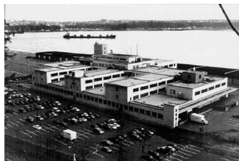
La gare maritime Champlain